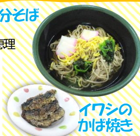
イワシのかば焼き

2/3(火)の給食は“みんなが健康で幸せに過ごせますように”という意味をこめた節分メニューでした。節分に食べると縁起が良いと言われている「イワシのかば焼き」も出ましたよ。「節分そば」には、悪天候に強いそばのように強くたくましく生きたい、そばのように人生を細く長く生きたい、そして麺類のなかでも切れやすいそばのように厄を切り捨てたいといった意味もあるようです。